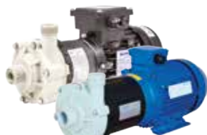
CTM odstředivá čerpadla s magnetickou spojkou