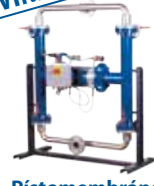
Pístomembránová čerpadla Steinle