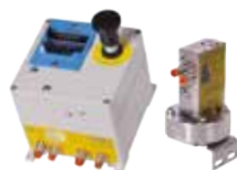
Systémy & příslušenství