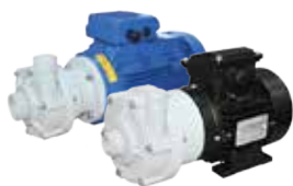
CTP plastová odstředivá čerpadla