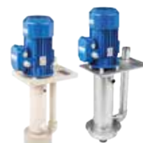
CTV vertikální odstředivá čerpadla