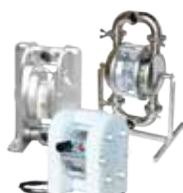
TC Inteligentní čerpadla