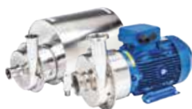
CTI & C H odstředivá čerpadla