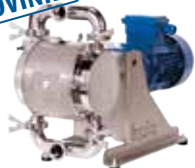
Elektricky poháněná čerpadla