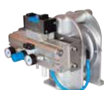
TF čerpadla pro kalolisy