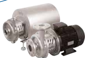
CTX odstředivá čerpadla