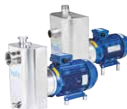
CTS samonasávací odstředivá čerpadla