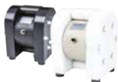
PE & PTFE čerpadla